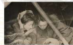
Подумай и ответь, почему так говорят