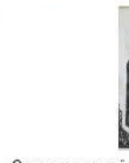
Очень маленький земной шар