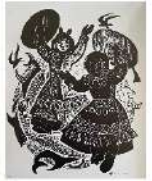
Головы моих друзей