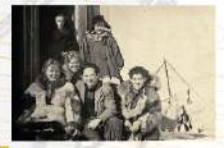
«От одного сознания, что в двух шагах Северный полюс, становишься человеком»